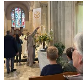
La lumière prise au Cierge Pascal