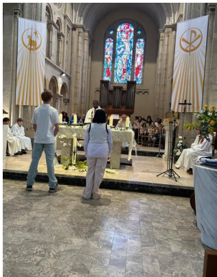
Les nouveaux baptisés revêtus de blanc