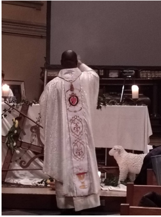
Encensement de l'autel