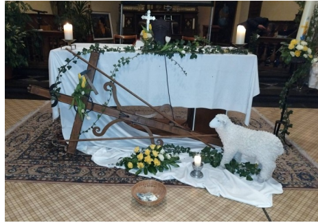
L'autel joliment décoré