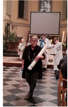
Distribution des Cierges Pascals aux communautés