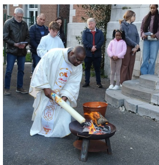
Le Cierge Pascal allumé au feu nouveau