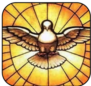
« Recevez l'Esprit Saint » p. 15