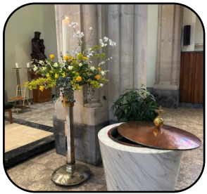
Photos célébrations Pascales p. 4 et 5