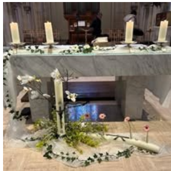
L'autel joliment décoré