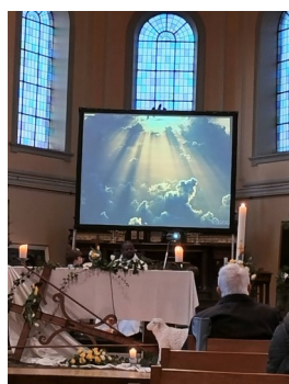
Powerpoint illustrant la lecture du récit de la création