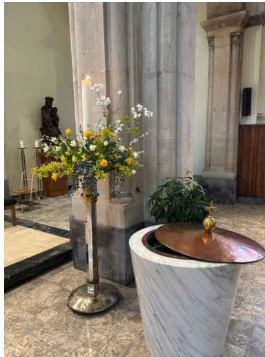
Le Cierge Pascal et les Fonts Baptismaux