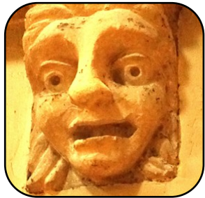
Journées église ouverte à Emael p. 3