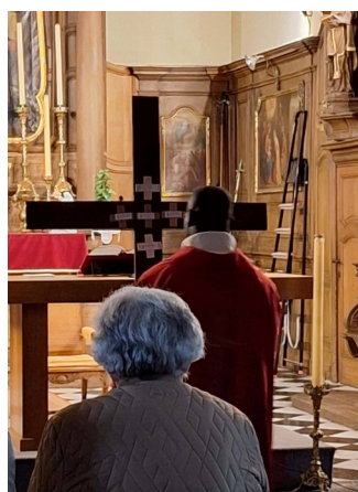
Recueillement devant la Croix