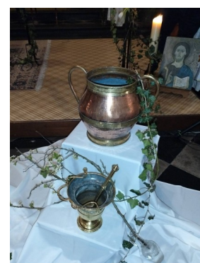
Eau bénite pour l'aspersion