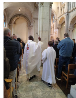
Aspersion de l'assemblée