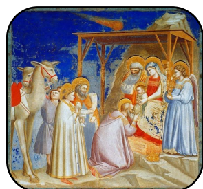
Ils se prosternèrent devant lui... p. 15