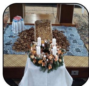
Échos messe du 30 novembre p. 5