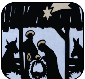
Les crèches de nos églises p. 6