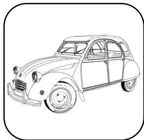
Bénédition des véhicules p. 4

En ces mois de mai et juin, nous souhaitons une bonne fête aux mamans et aux papas !