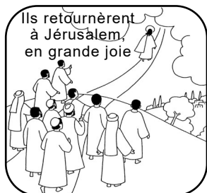
L'Évangile médité: Ascension p. 15