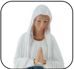
Pèlerinage paroissial à Banneux p. 13